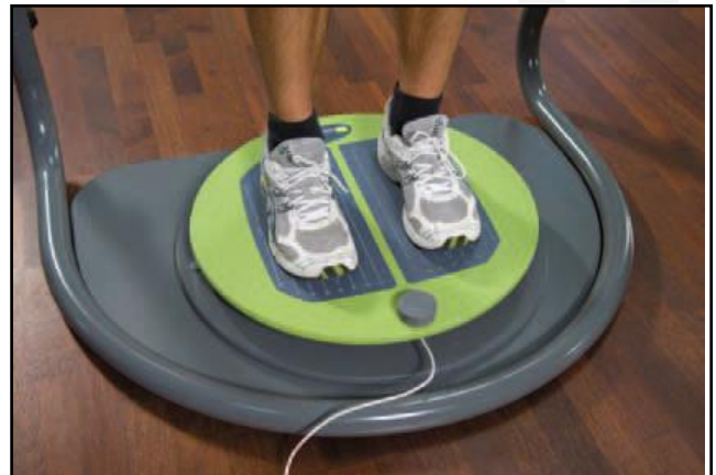
Abb. 1: Testgerät MFT S3-Check