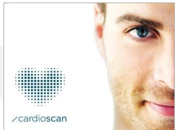
Abb. 1: Cardio Scan Imagebild