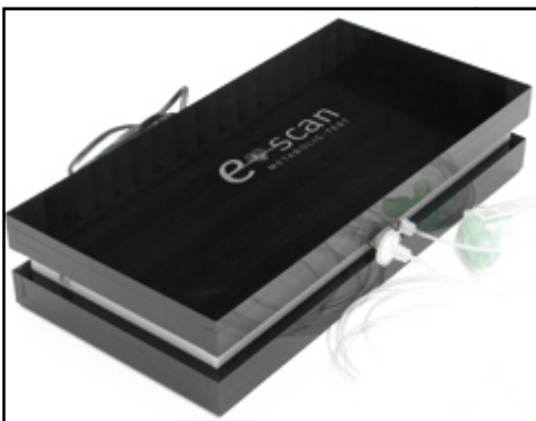
Abb. 2: Testgerät e-scan