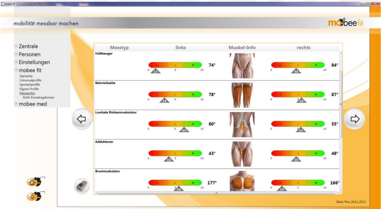
Abb. 3: Beispielauswertung