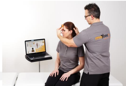
Abb. 1: Messung der Schulter-Nacken-Muskulatur