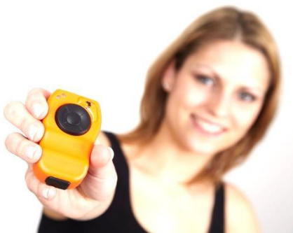
Abb. 2: mobee fit