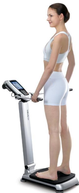
Abb. 1: Testperson auf dem Diagnosegerät