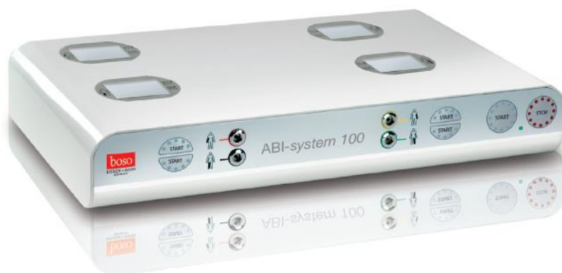
Abb. 1: bosso ABI-Messgerät