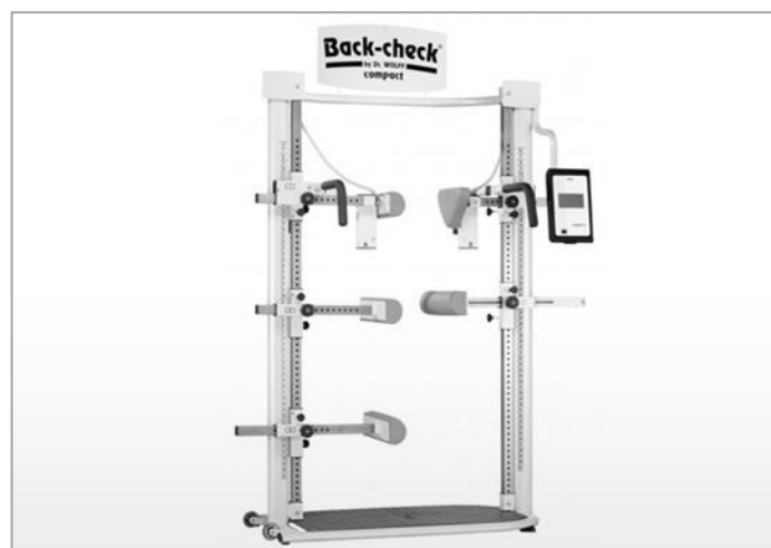
Abb. 1: Testgerät Dr. Wolff Back-check 608 compact